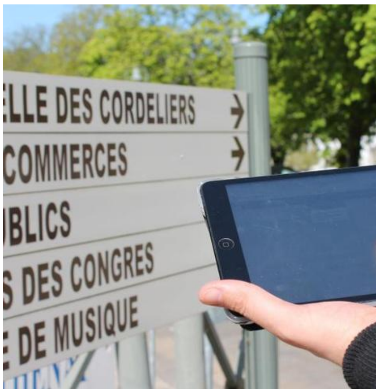
Les jeunes renseigneront l'accessibilité de la ville sur des tablettes numériques.